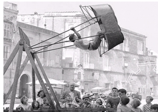
Bellabruixeta. (n.d.). La barquilla . Bella Bruixeta. https://bellabruixeta.wordpress.com/tag/la-barquilla/