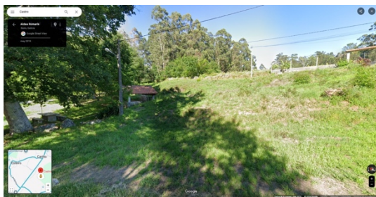
Google Maps. (2024). O Castro [Pantallazo]. Google Maps. https://www.google.com/maps/@42.6214595,-8.8721517,3a,75y,61.43h,85.89t/data=!3m1!1e1!3m5!1sFF_917vOpu6CM2JLeqRASw!2e0!6shttps:%2F%2Fstreetviewpixels-pa.googleapis.com%2Fv1%2Fthumbnail%3Fcb_client%3Dmaps_sv.tactile%26w%3D900%26h%3D600%26pitch%3D4.108398217215722%26panoid%3DFF_917vOpu6CM2JLeqRASw%26yaw%3D61.43034509434608!7i16384!8i192?hl=es-ES&entry=ttu&_ep=EgoyMDI0MTEyOS4yIiKXMDSoASAFQAw%3D%3D

Lugar donde ocurrió se desarrolló la historia.